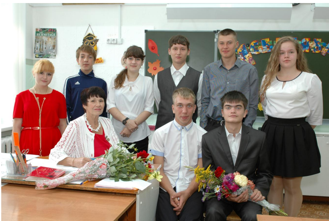
Выпуск 2017 года