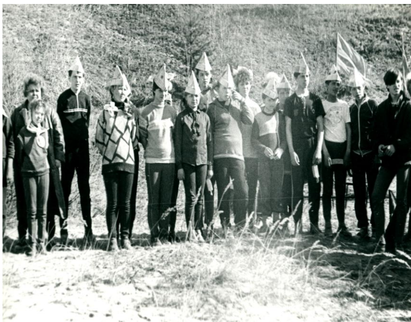
Туристический слет на острове Зуй – май 1978 года.