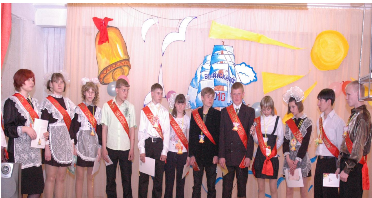
Выпуск 2010 года