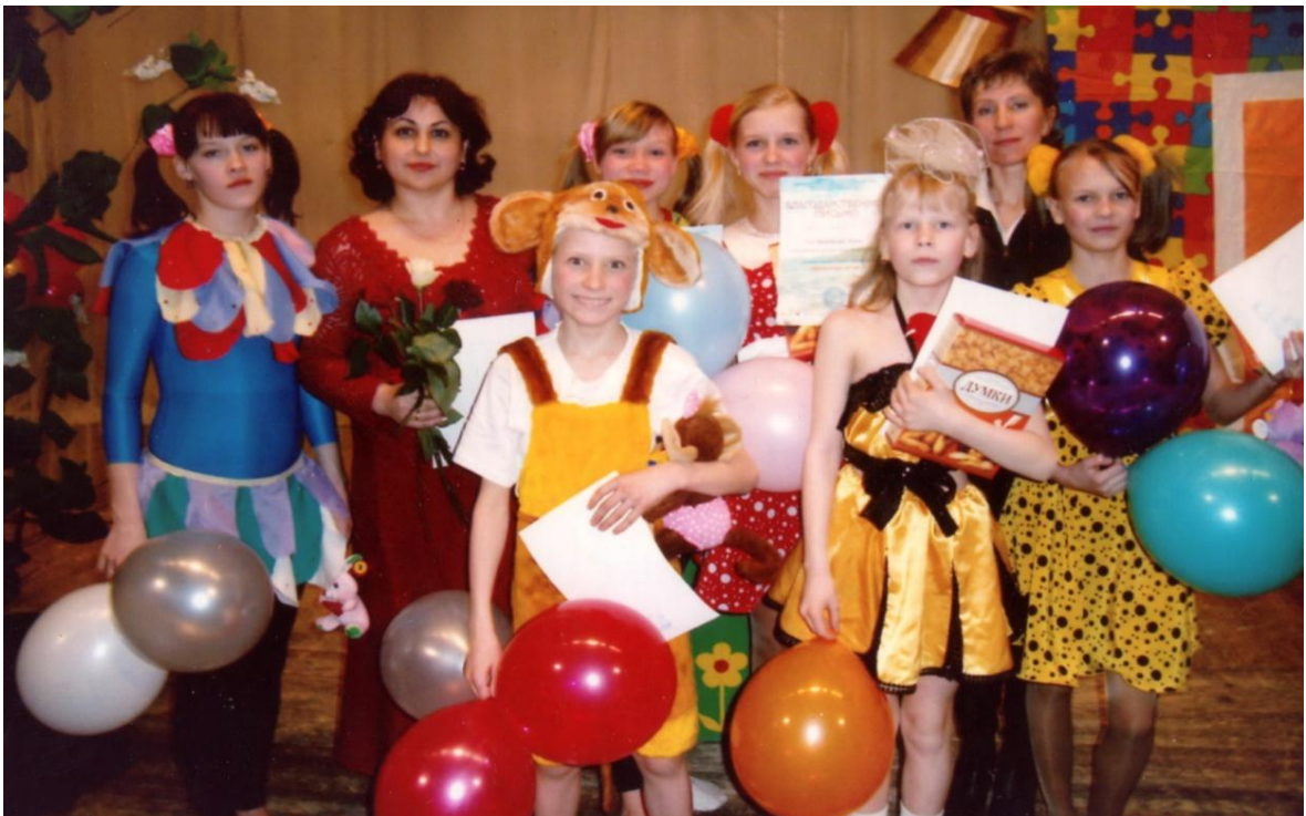
После успешного выступления на областном фестивале «Байкальская звезда»