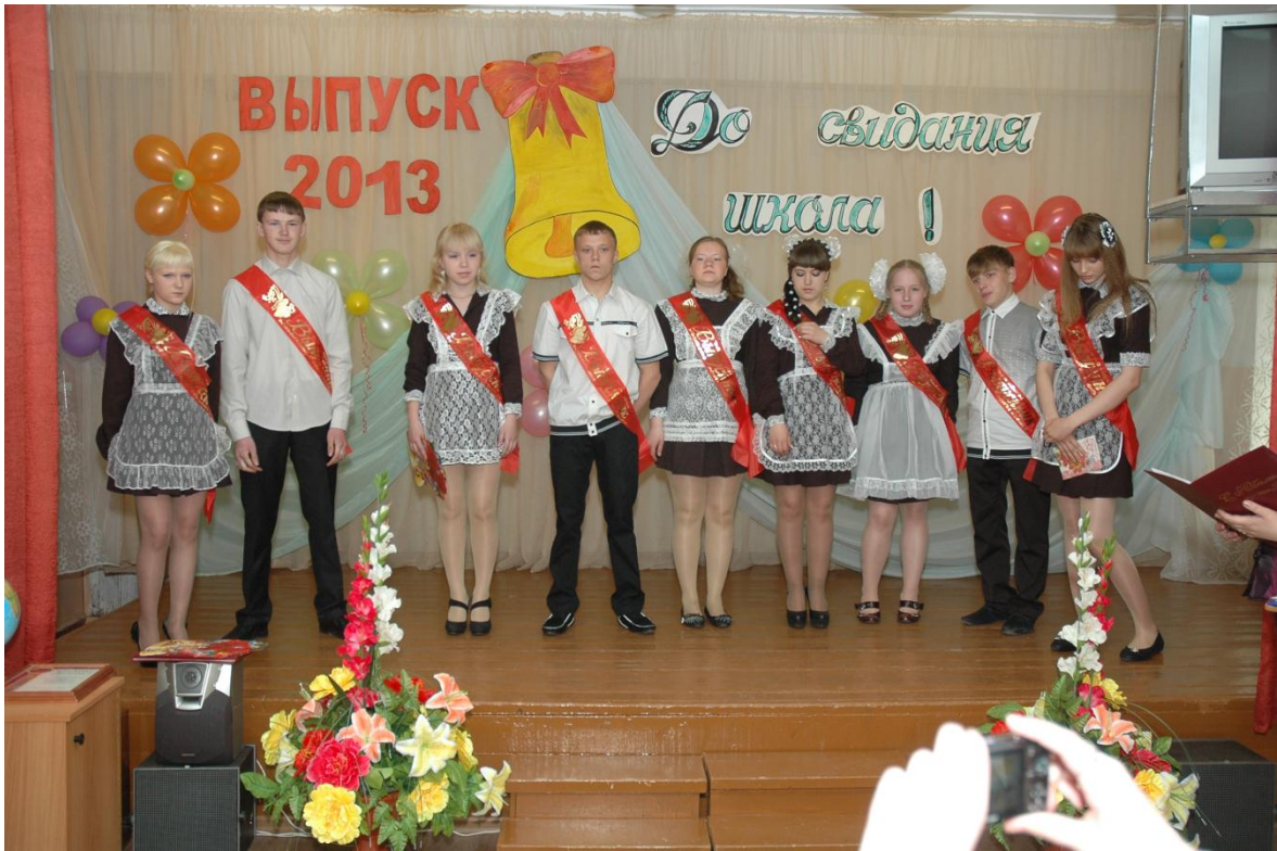
Выпуск 2013 года