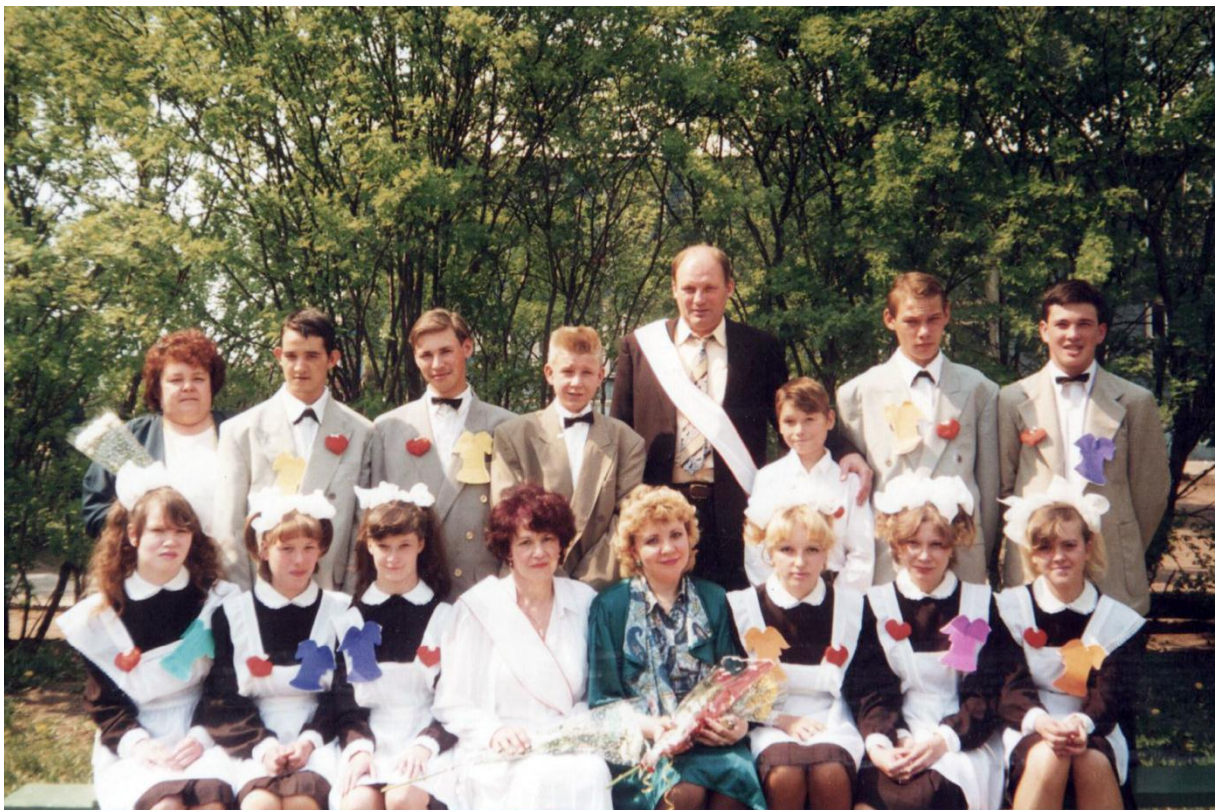
Выпускной 1997 год.