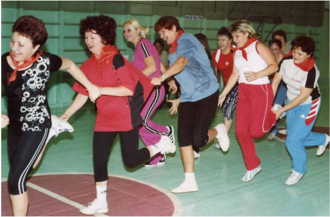
«В здоровом теле – здоровый дух...»