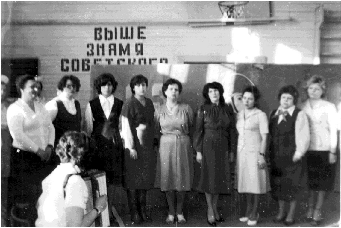
Праздники бывают и у педагогов...