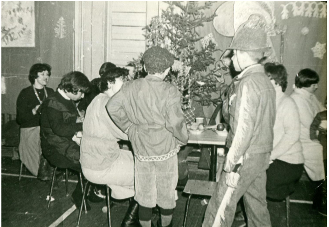
Любимый праздник – Новый год.