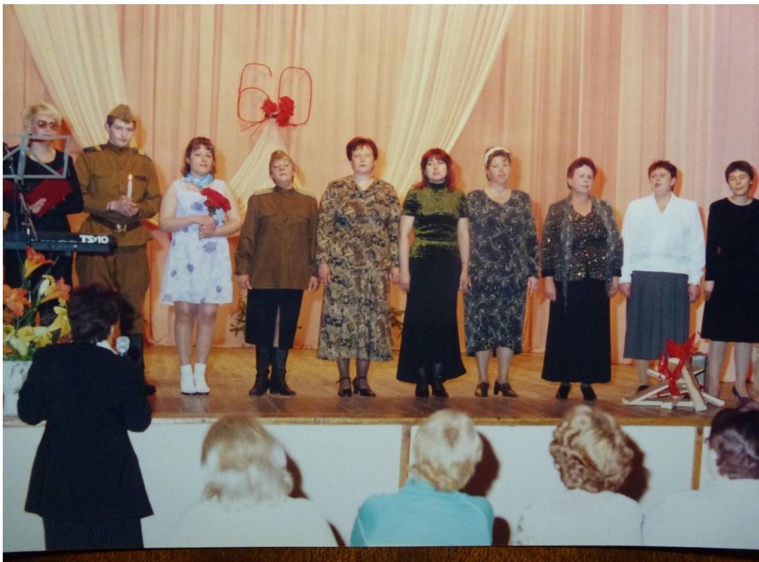
Городской фестиваль военной песни 2005г.