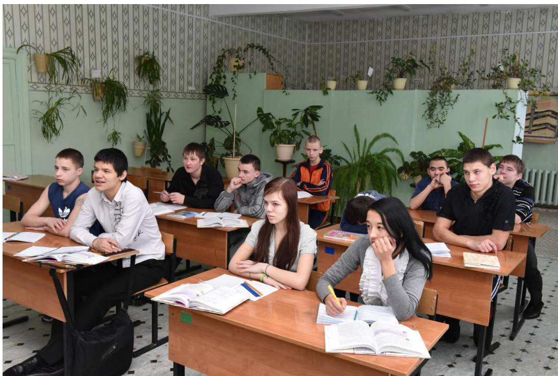
На уроке биологии.

1 сентября 2013 школа приняла 31 воспитанника из специальной (коррекционной) школы-интерната для детей-сирот и детей, оставшихся без попечения родителей № 4 г. Иркутска связи с проводимым там капитальным ремонтом. Перемены коснулись и педагогического состава – дополнительно были приняты воспитатели.