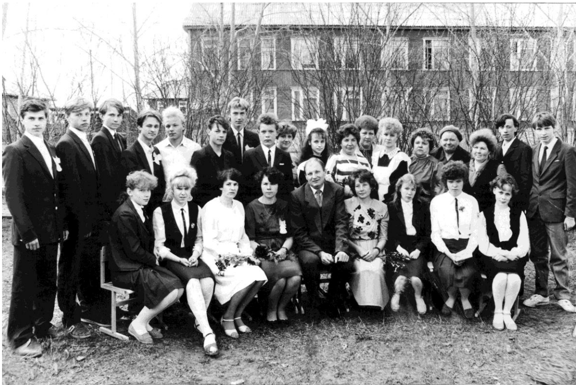
Выпускной 1991 года.