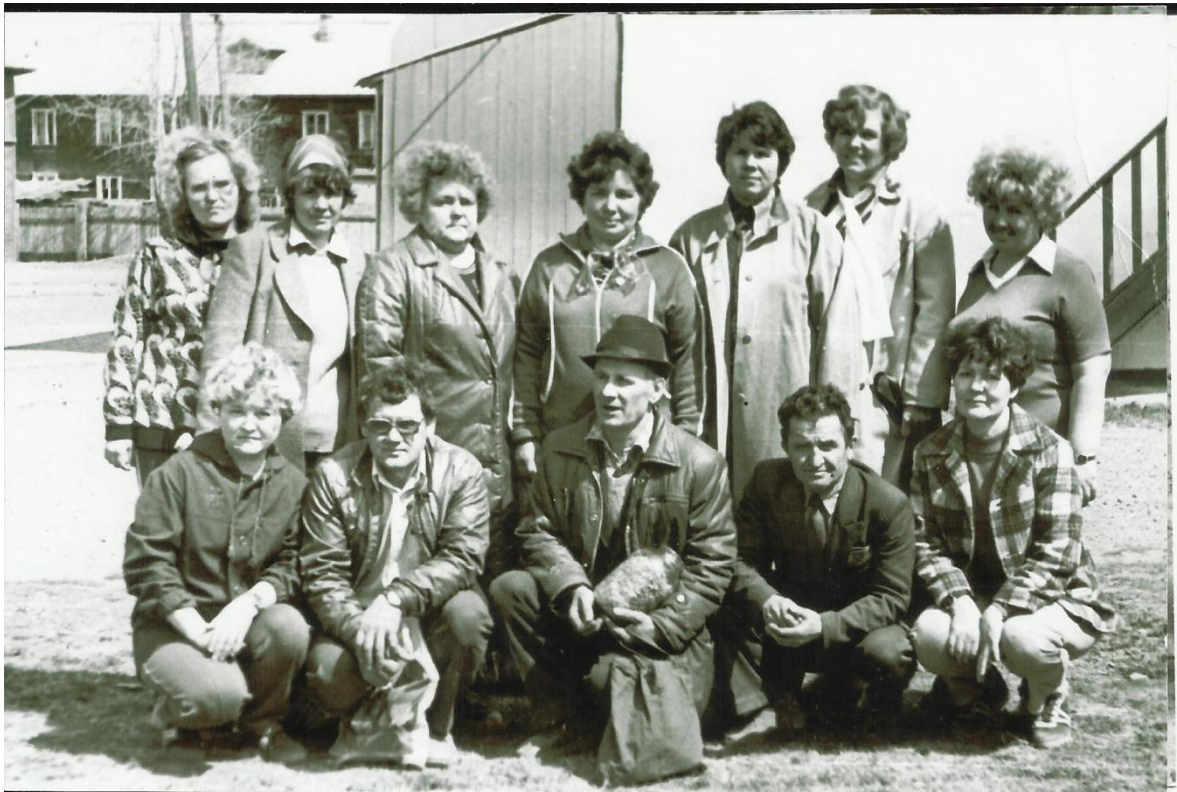
После Коммунистического субботника