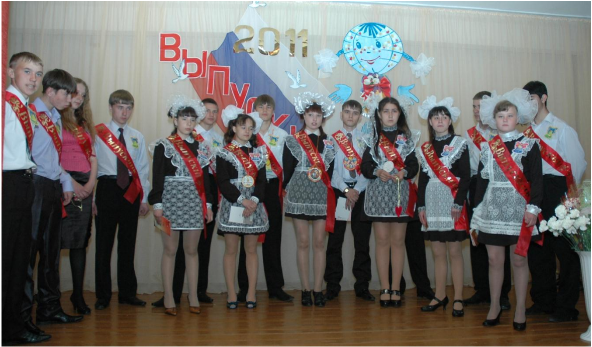
Выпуск 2011 года