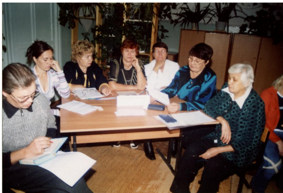
Методическое объединение учителей начальных классов