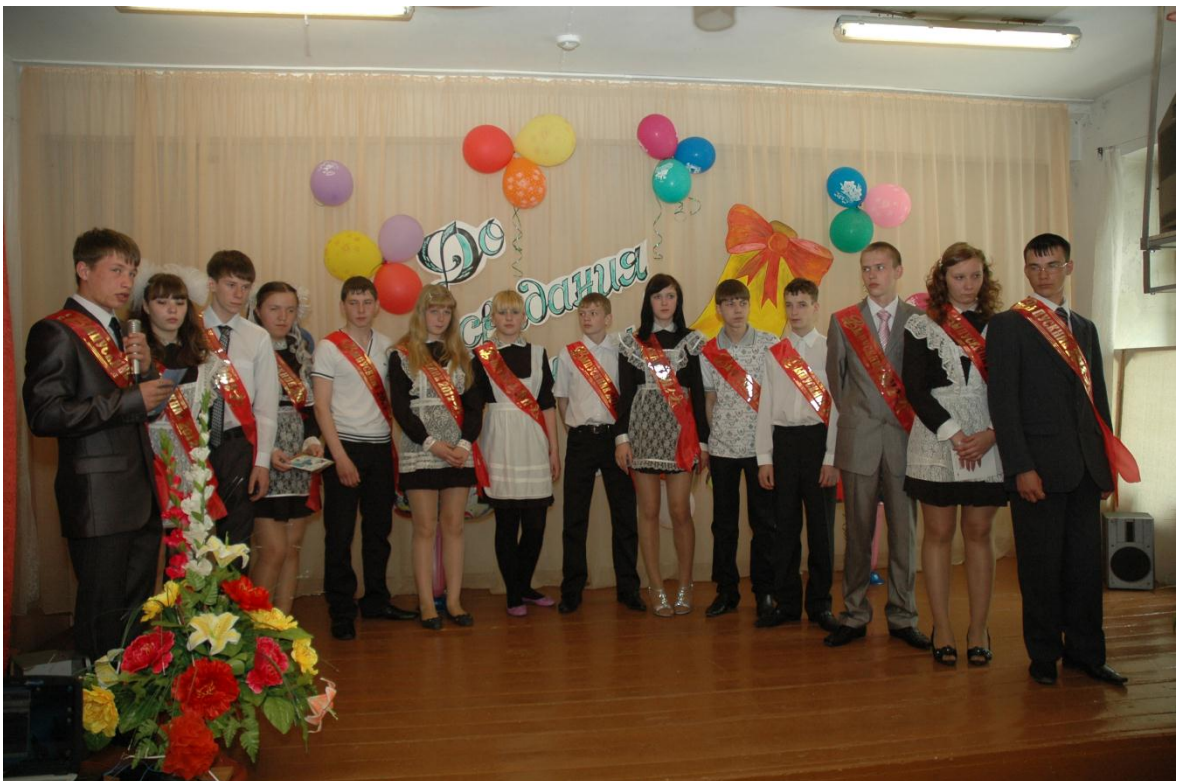
Выпуск 2012 года