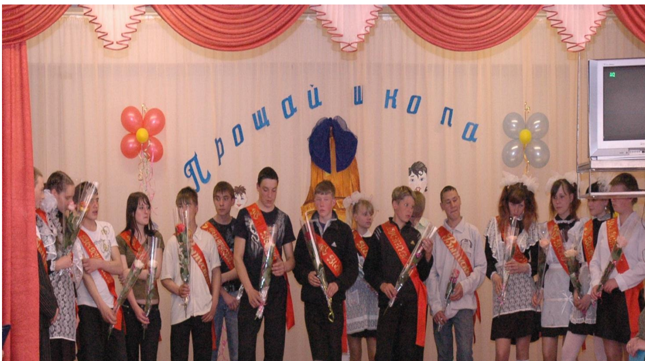
Выпускники 2009 года.

Выпускники школы ежегодно успешно заканчивают обучение и большинство из них поступают в профессиональные учебные заведения Иркутской области. С 1968 года было выпущено более 600 учащихся.