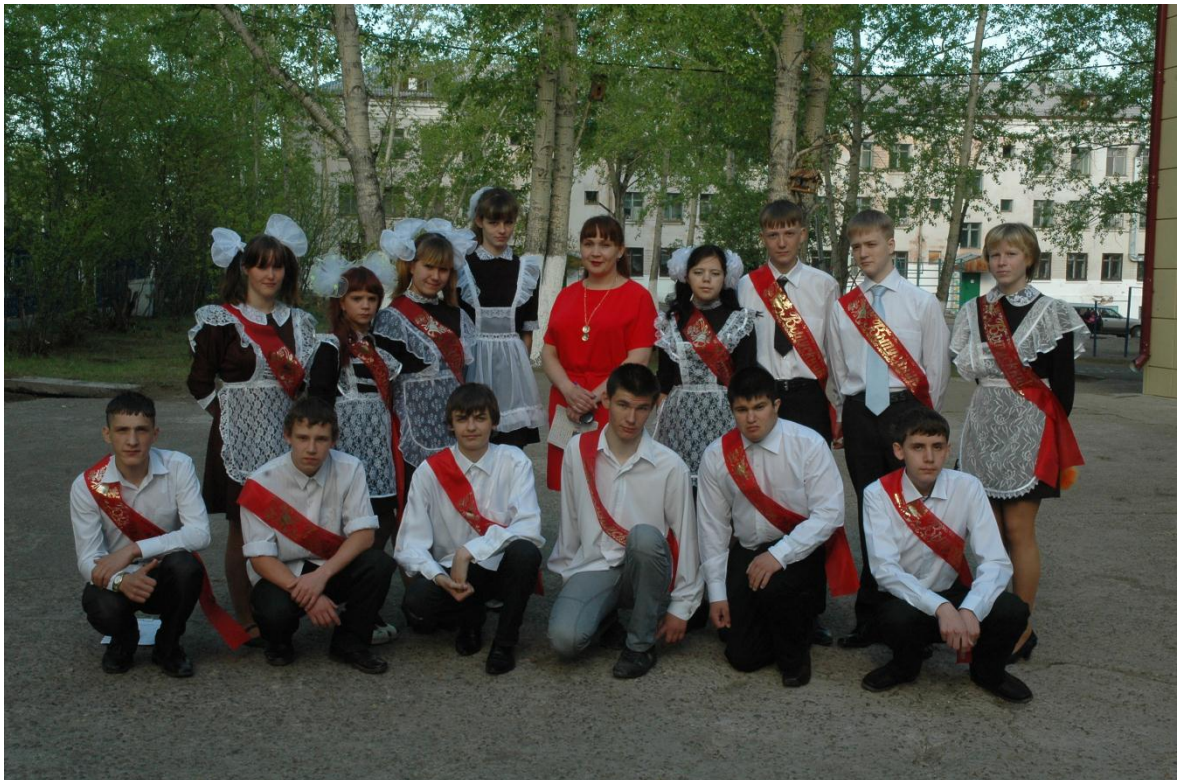
Выпуск 2014 года.