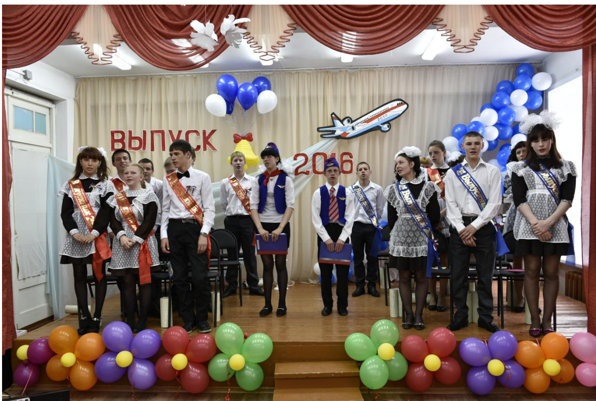
Выпуск 2016 года.