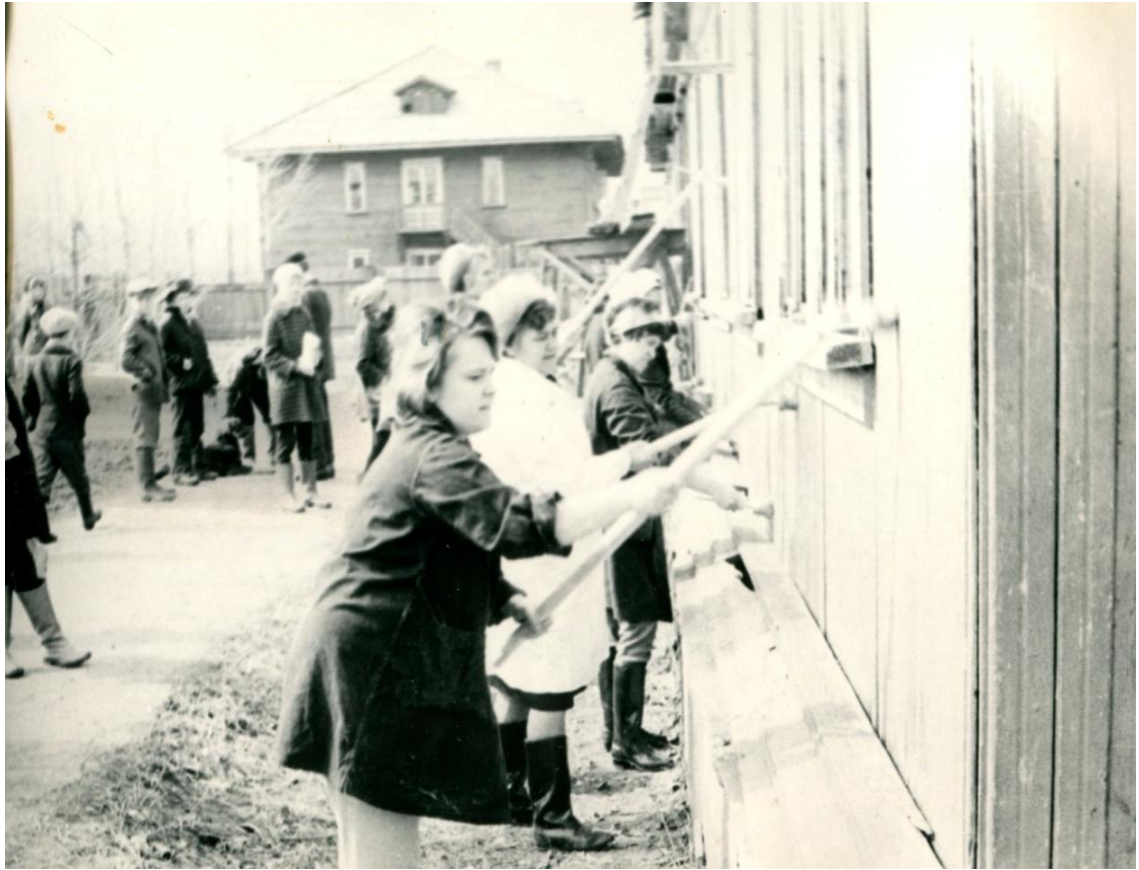
Коммунистический субботник, май 1975 года