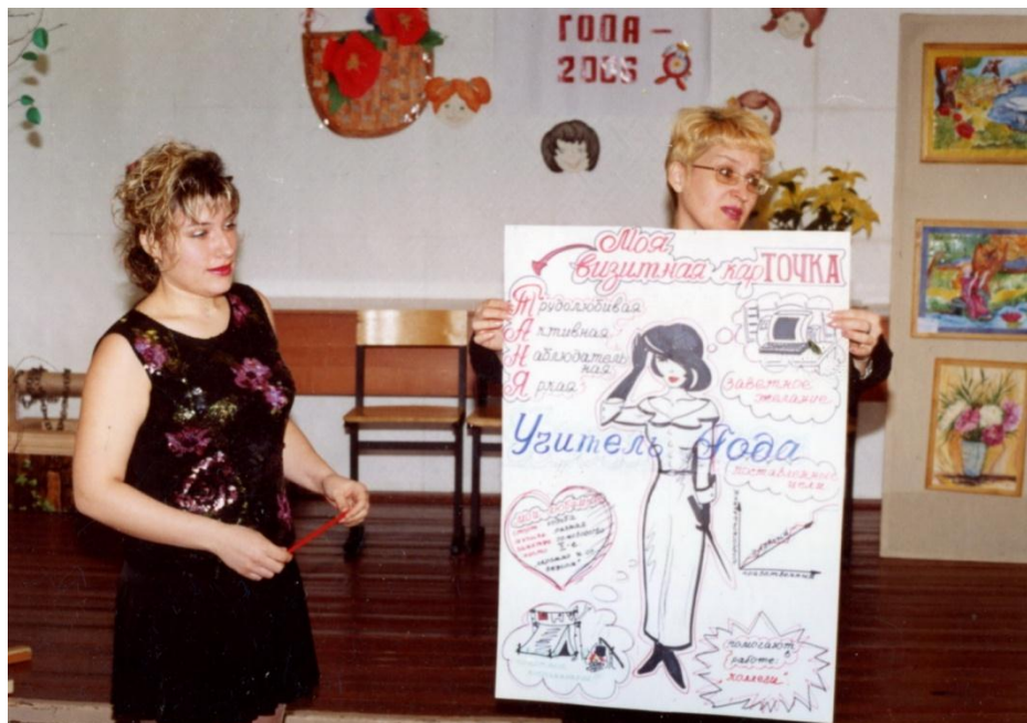
Конкурс «Учитель года» 2003г.

Интересной и насыщенной была жизнь не только у учащихся, но и у их учителей и воспитателей. Конкурсы педагогического мастерства, спортивные соревнования, выезды на природу и экскурсии на предприятия города.