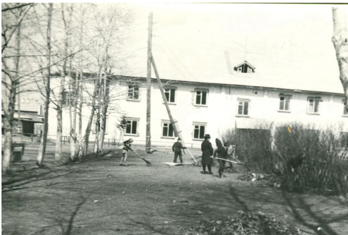
Майский субботник на территории школы.